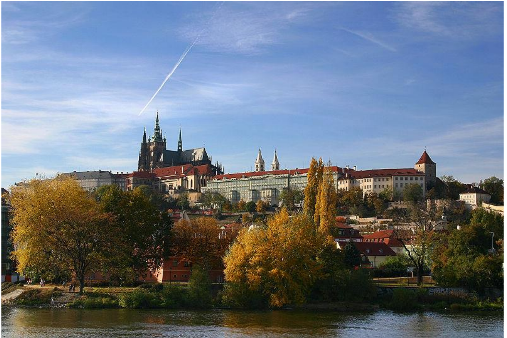
Pražský hrad – sídlo prezidenta České republiky