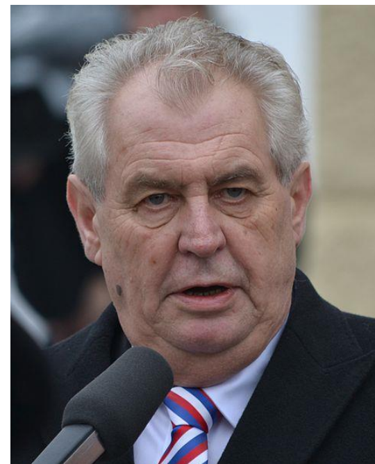
Miloš Zeman současný prezident České republiky