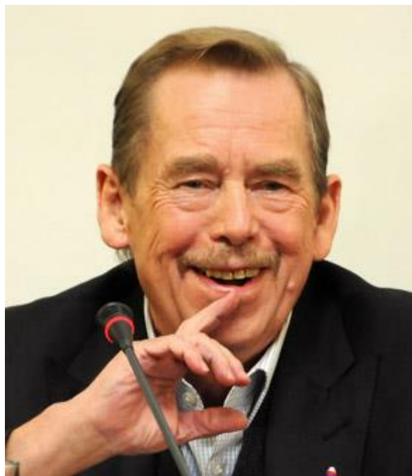
Václav Havel 1. prezident České republiky