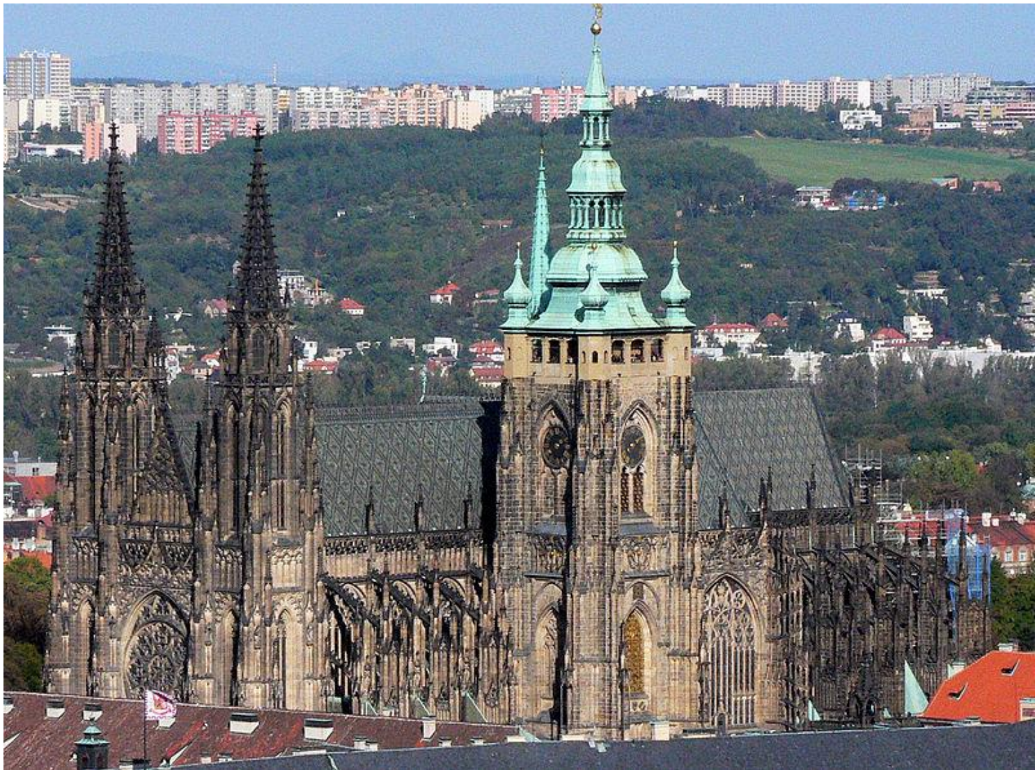
Katedrála svatého Víta, Václava a Vojtěcha