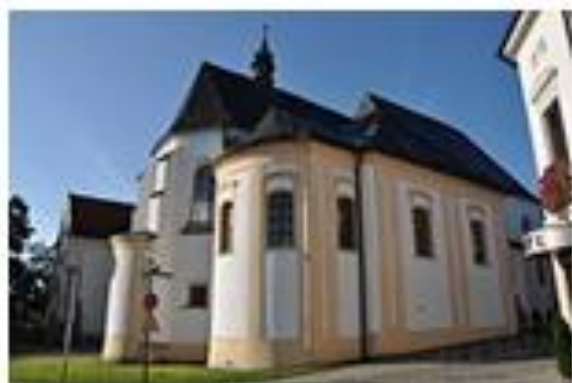
Bývalý kostel Zvěstování P. Marie