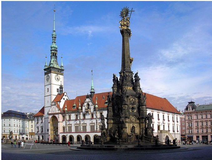
Horní náměstí s radnicí a Sloupem Nejsvětější trojice