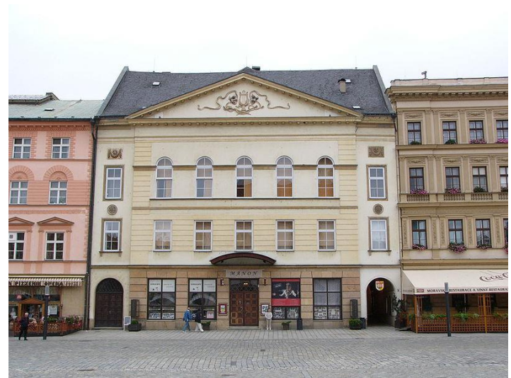
Moravské divadlo v Olomouci