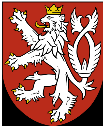
malý státní znak