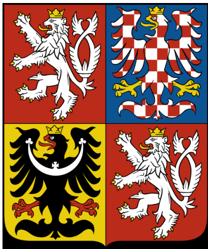
velký státní znak